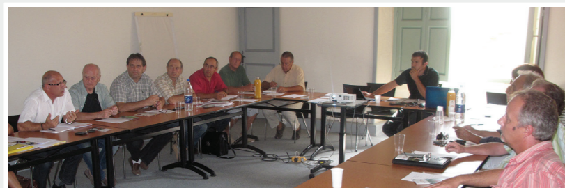
Réunion de travail avec les maires du canton à la maison départementale de l'environnement à Restinclières (Prades le Lez)